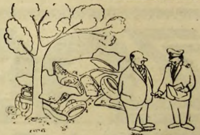
Desen de Zoltan SZABO