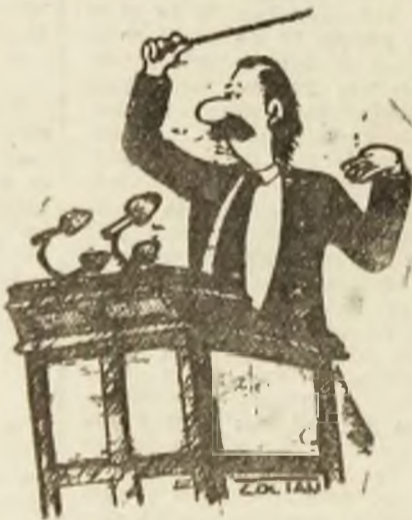
Desen de Zoltan SZABO