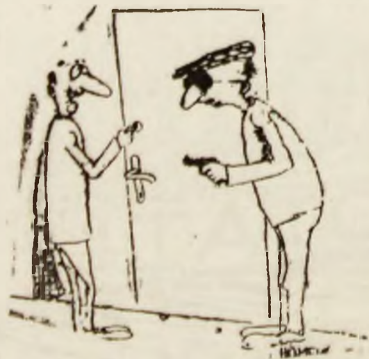
— Ti-as da eu plăcere banii, dar vin de la piață! Desen de R. HUMEL.