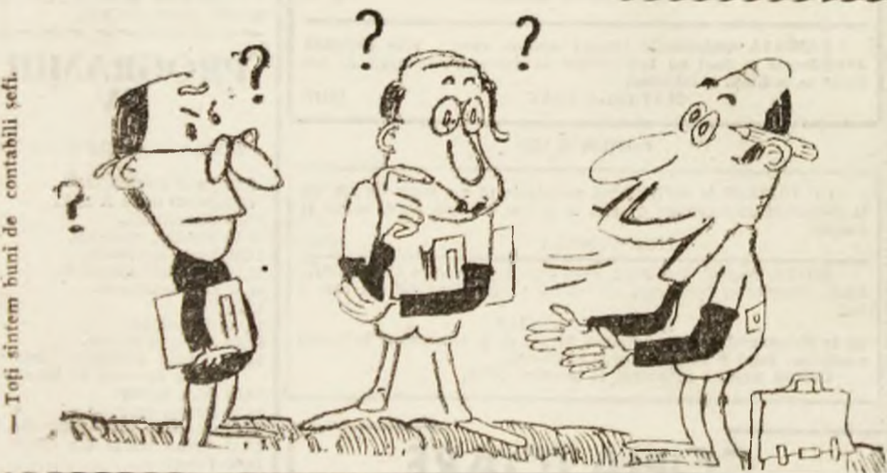
Toți sîntem buni de contabili șefi.