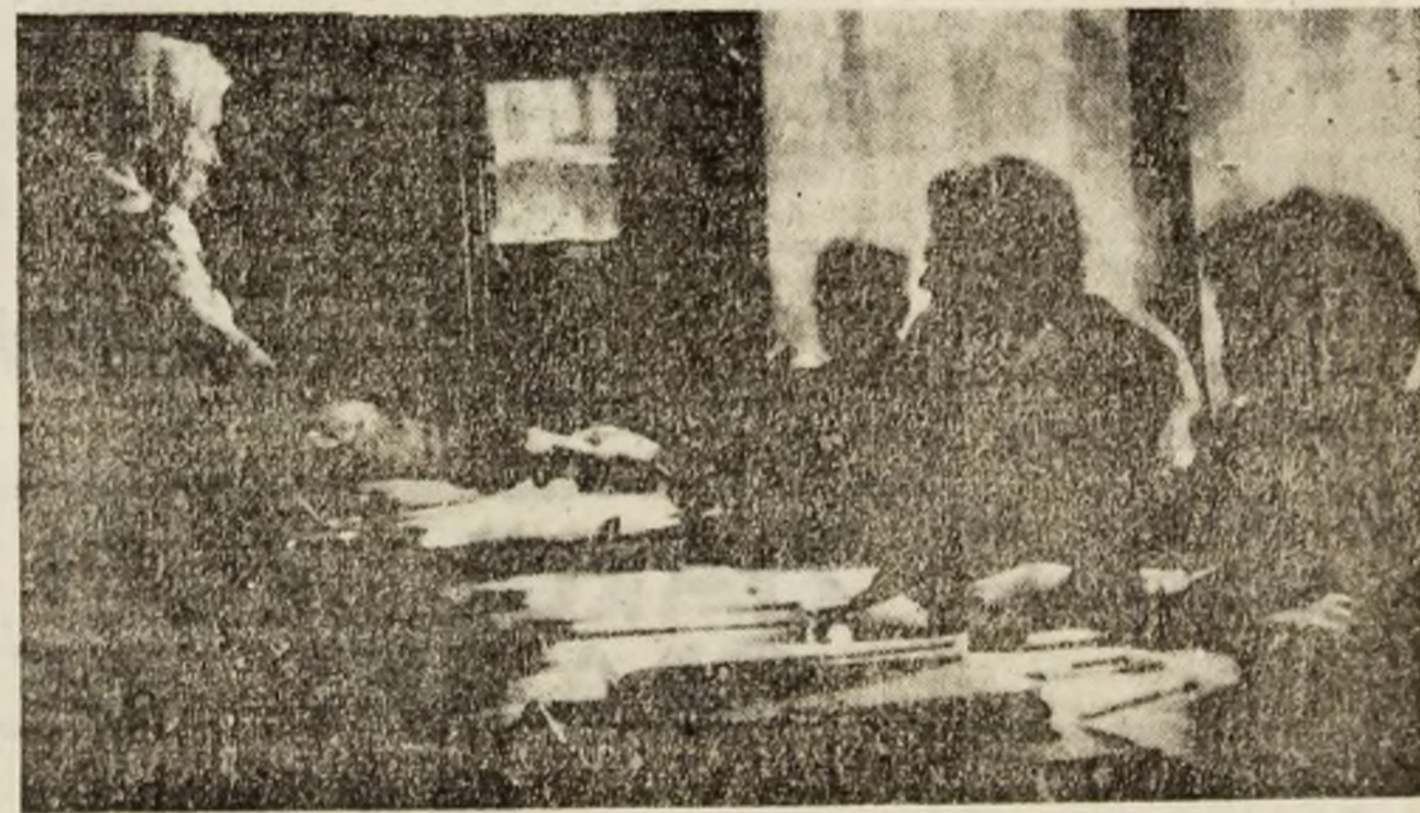
Participarea la vot înseamnă participare la actul guvernării.

numai în anul pe care în curînd o să-l încheiem, ci în ultimii doi ani și jumătate, că neavînd suficiente resurse energetice, termoficarea marilor orașe va fi o problemă deosebită; că aprovizionarea cu gaz metan se rezumă la unele rezerve mult mai mici decît pînă acum, pentru că s-au redus cantitățile importate; că prețul la benzină, motorină și alți carburanți precum și la combustibili solizi a cunoscut mal multe creșteri succesive și nu este exclus să cunoască noi salturi, că devalorizarea artificială a monedei naționale față de dolarul american și celelalte valute ale lumii continuă cu intenții sinucigase; că produsele agroalimentare sînt și insuficiente dar și foarte scumpe și multe, multe alte argumente care ne fac să nu fim prea încrezători în promisiunile făcute electoratului de lupta pentru ciolan a partidelor politice. Dar totuși credința că vom izbîndi nu trebuie să ne părăsească, deși știm că ne va fi foarte greu. Dar, oare, ne-a fost vreodată ușor?