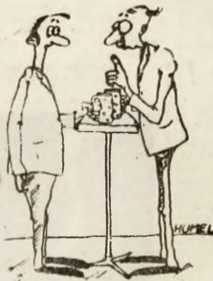
Desen de Robert HUNEL