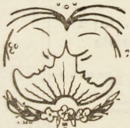
Ilustrație de Ladislau SCHMIDT