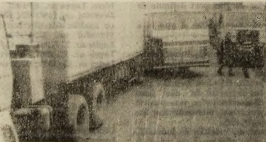
„Ai noștri” blochează ieșirea din vamă.

unde-s, mă, dobitocii ăștia, de pămînt?”, am scrisnit noi din dinți. Dar n-a durat mult pînă să ne dumirim cu cine avem de-a face. Una avea nr. 31 GL 1734, iar cealaltă 31 GL 7807. Decl, ai