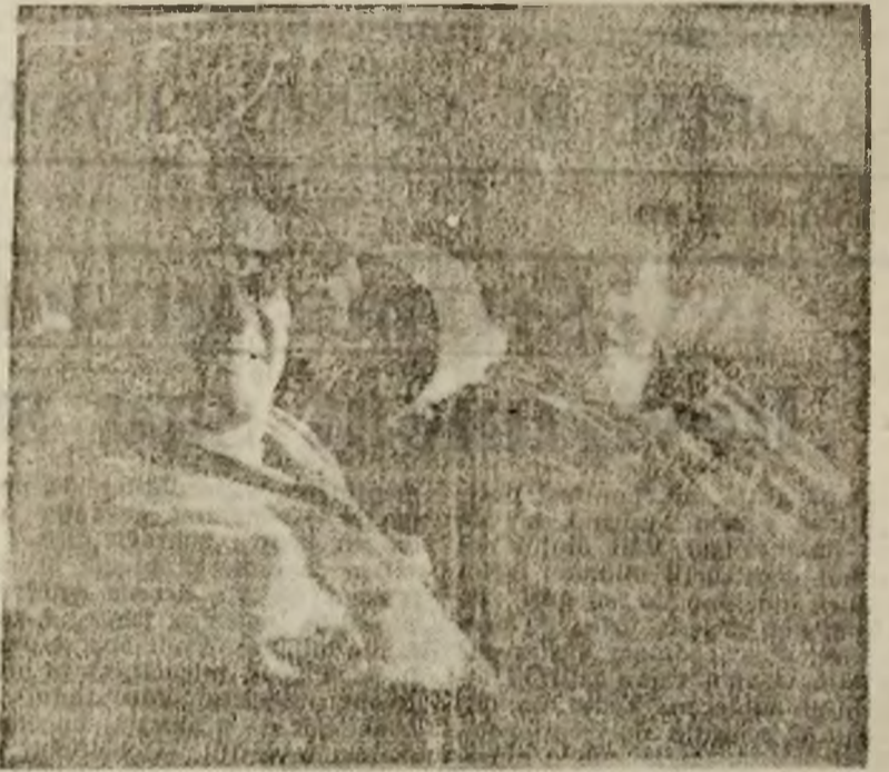
E vremea patronilor.