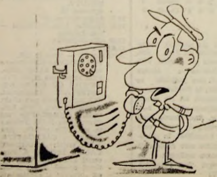
— Îmi pare rău iubito, dar nu ne mai putem întâlni la restaurantul „Bulevard” — ne-au ocupat locul cei de la SRI !!! Desen de Vali LOCOTA

Petroșaniul mai trebuie să asigure paza trenului, salubritatea lui, cazarea însoțitorilor de vagon și a personalului de serviciu din tren, până când toate aceste probleme vor fi rezolvate. „Oltenia Expres” nu va putea circula mai departe de Tg. Jiu.