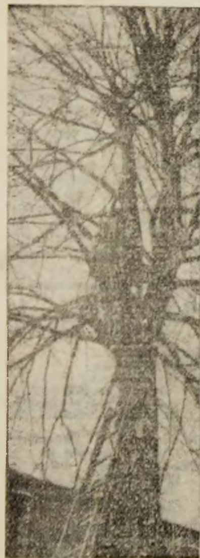
SUNTEM ÎN POMI!