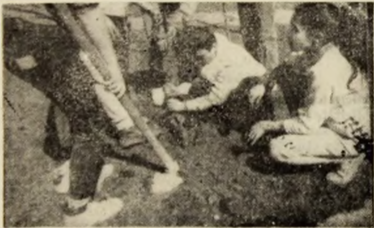
Să v-arăt eu cum se sapă!

ETAPA VIITOARE, 6 mai: Metalul Crisicior — Minerul Aninoasa; Haber Hațeg — Mureșul Deva; Minerul Ghelari — Victoria Călan; Metaloplastica Orăștie — CFR Simeria; Minerul Vulcan — Minerul Telieuc; Constructorul Hunedoara — Aurul Brad; Minerul Bărbăteni — Faviar Orăștie; Minerul Certej — Parângul Lonea.