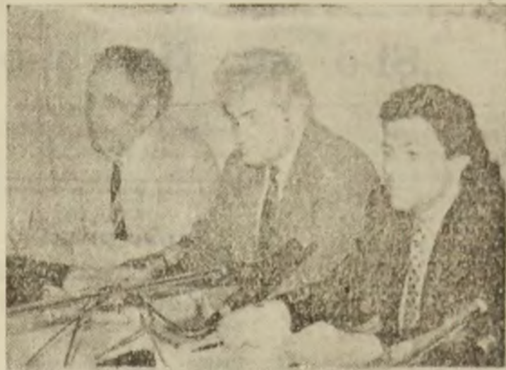
Conferință de presă

expo SA și firma britanică „International Trade Exhibitions Ltd“ (ITE), firmă cu o vastă experiență în domeniu. Pe parcursul unei săptămâni întregi numeroșii vizitatori au putut admira, iar și mai numeroșii oameni de afaceri (nota bene!) au putut efectua importante contracte cu produse de ultimă oră ale unor firme ce credem, nu mai au nevoie de altă prezentare: Opel, Audi, Toyota, Citroen, Dacia, Daewoo, DAF, Fiat, Iveco, RABA, Renault, Oltecit, Skoda, Volkswagen, Bosch, Michelin, Shell etc.